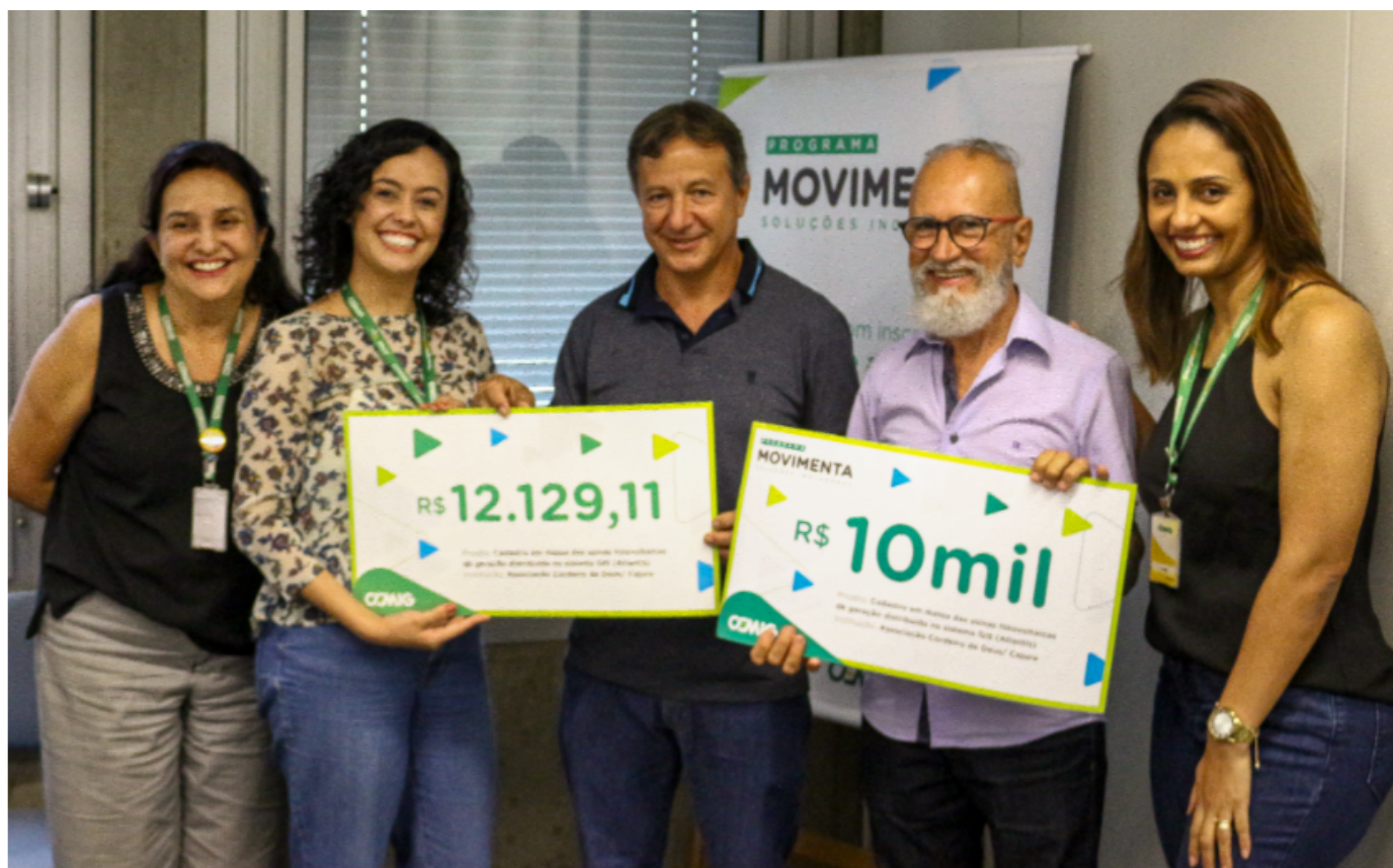
Foto 5 - Empregados, padrinhos das instituições e representantes recebem o prêmio.