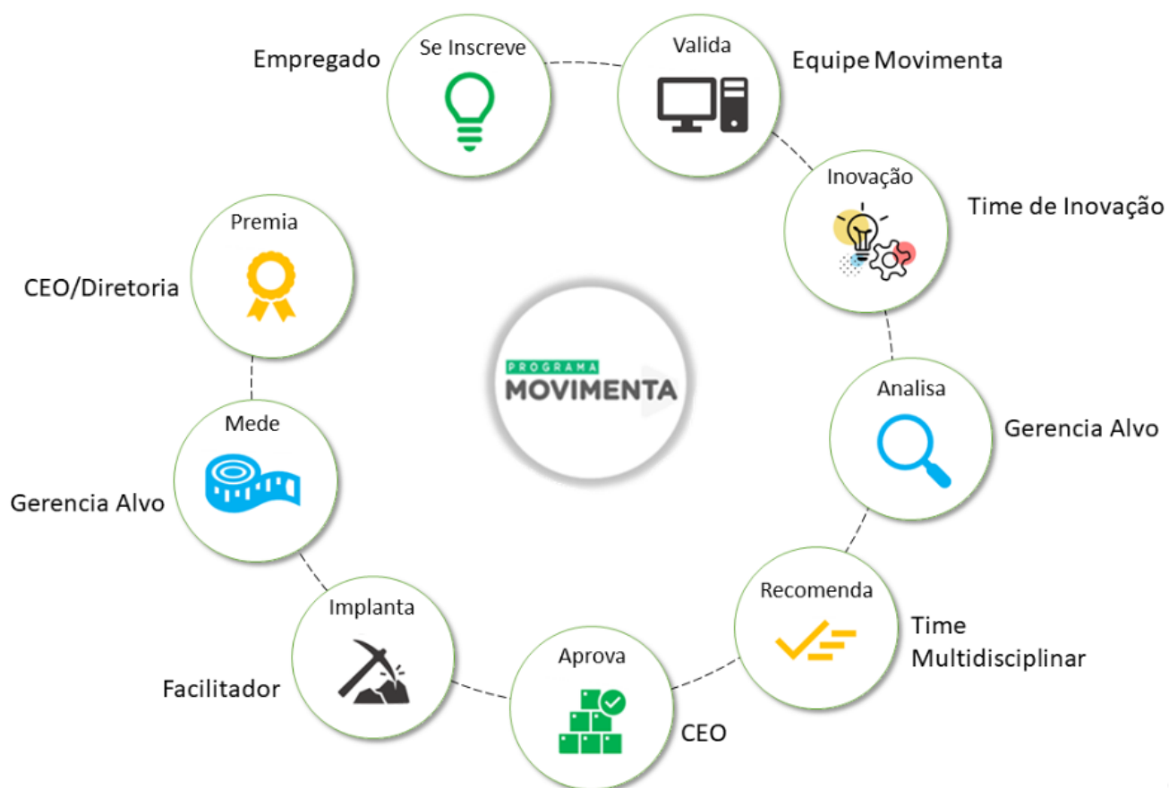
Figura 1 - Etapas do Programa Movimenta