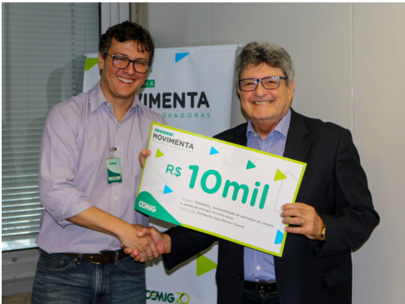
Foto 7- Empregado e representante da Fundação Sara entrega do Cheque simbólico da doação.