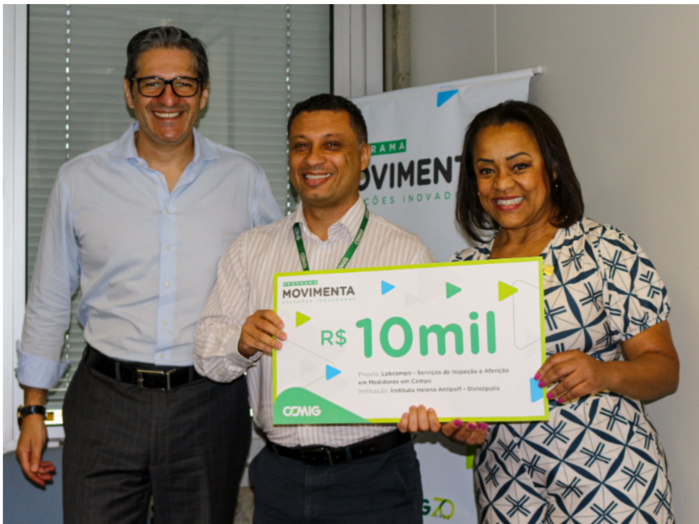
Foto 6 - Empregados, padrinhos da Fundação recebem o prêmio.