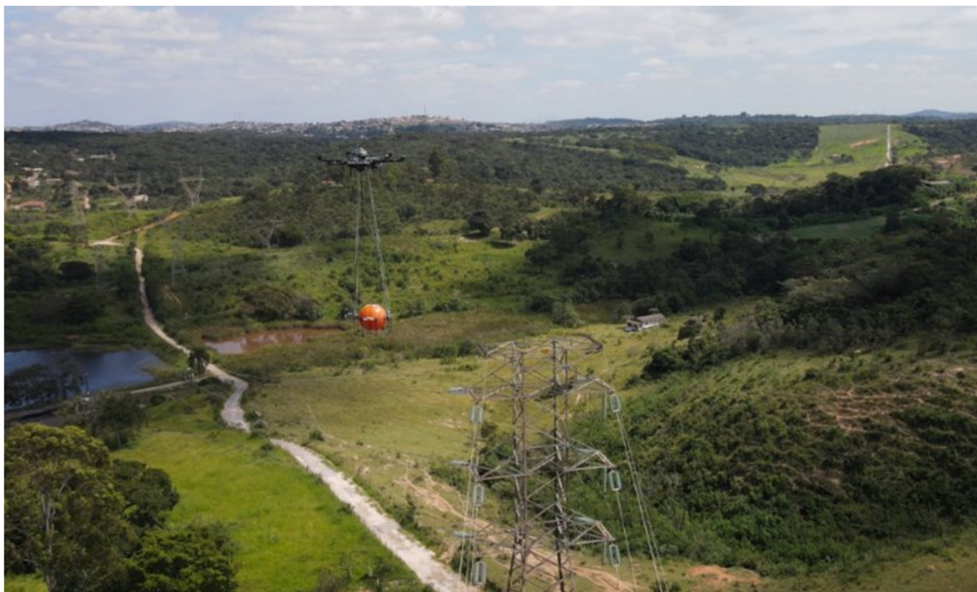
Foto 3 - Uso do drone para instalação das esferas de sinalização em linha viva